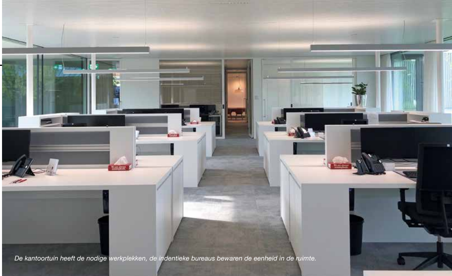
De kantoortuin heeft de nodige werkplekken, de indientieke bureaus bewaren de eenheid in de ruimte.

Wij zijn in een vroeg stadium betrokken bij de bouw, dit zorgt voor een soepele samenwerking. In de kantoortuin hebben we de 'oude' bureaus, die wij 10 jaar geleden ook gemaakt hebben, een opfrisbeurt gegeven. Want waarom zou je kapitaal vernietigen als deze bureaus perfect hergebruikt kunnen worden? Er zijn in dezelfde stijl nieuwe exemplaren bijgemaakt om de kantoortuin compleet te maken. Tot in detail is hier over nagedacht, zoals het wegwerken van de snoeren in de poten van de bureaus. Ik ben ervan overtuigd dat wanneer je samenwerkt met een fijne club mensen, je dit terugziet in het eindresultaat. We kijken met een heel positief gevoel naar hetgeen er gerealiseerd is, even als naar het totale proces!"