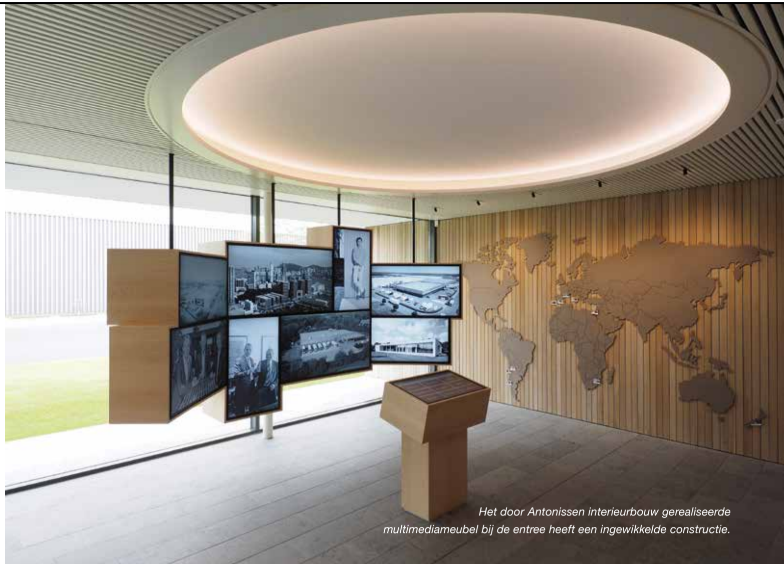
Het door Antonissen interieurbouw gerealiseerde multimediameubel bij de entree heeft een ingewikkelde constructie.