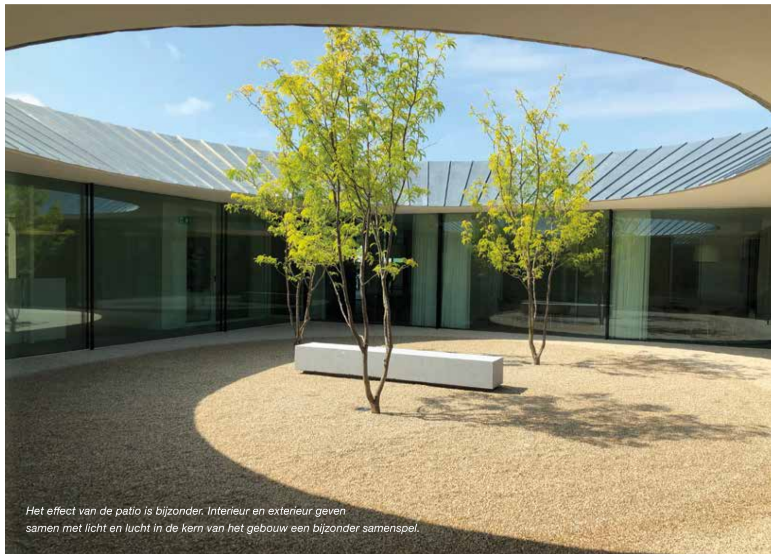
Het effect van de patio is bijzonder. Interieur en exterieur geven samen met licht en lucht in de kern van het gebouw een bijzonder samenspel.

Aartsen is een toonaangevend import- en exportbedrijf met het totale groenten- en fruitpakket uit alle delen van de wereld. Het is van oudsher een familiebedrijf dat door expansieve groei keer op keer genoodzaakt is het terrein en de gebouwen uit te breiden. Als groeiende organisatie ontstaat er op zeker moment ruimtegebrek. Er is aan ambitie geen gebrek en begin 2016 wordt er samen met de architecten van Grosfeld Bekkers van der Velden Architecten plannen gemaakt voor een nieuw hoofdkantoor. Al snel merkten ze dat het bestaande kantoor nog grotendeels een 2016-uitstraling had, terwijl het in 2004 is ontwikkeld en in 2006 is gebouwd. Op basis van wat er was, is er een 2.0-versie verwezenlijkt. Qua techniek en klimaatbeheersing is er veel aangepast en ook qua uitstraling is er naar de toekomst gekeken. In 2006 is het op zo'n manier gebouwd dat het uit te breiden was. Maar wie had kunnen voorspellen dat er in 2019 een verviervoudiging in oppervlakte plaats zou vinden?