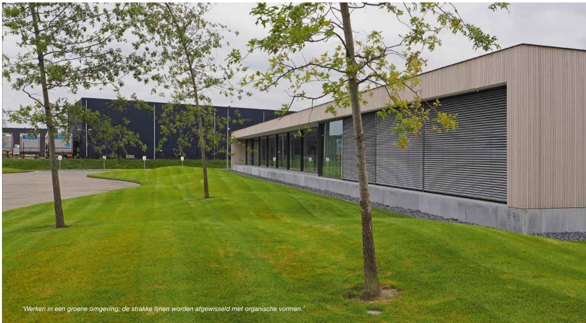
‘Werken in een groene omgeving; de strakke lijnen worden afgewisseld met organische vormen.’