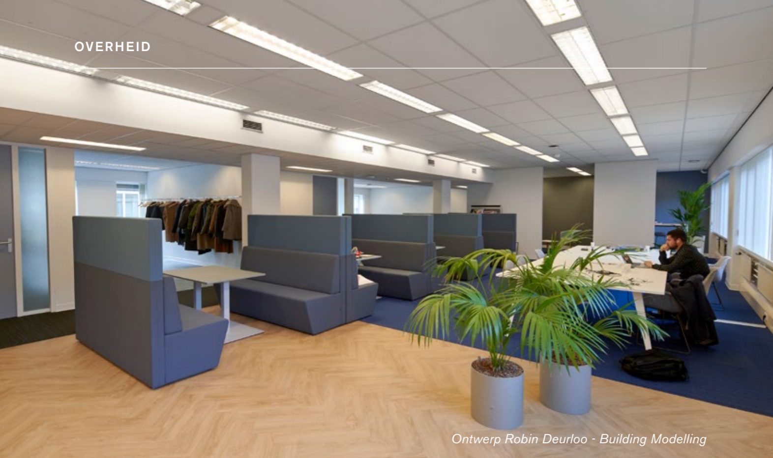
Ontwerp Robin Deurloo - Building Modelling